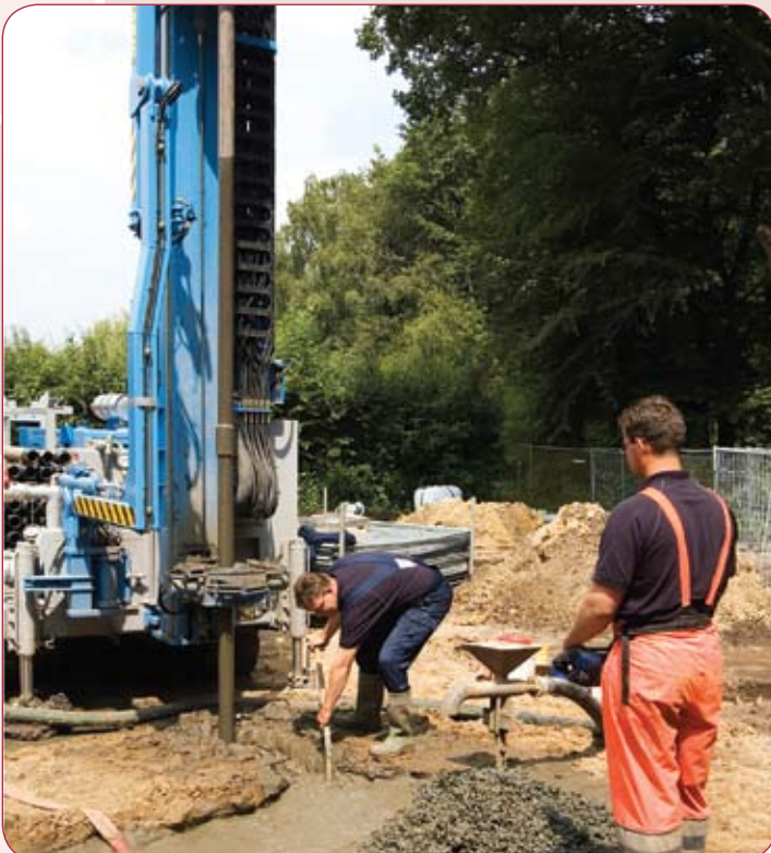
In Meerstad wordt tot op een diepte van vijftig meter geboord

Ten einde de warmtebron niet uit te putten is het van belang om af en toe warmte in de bodem terug